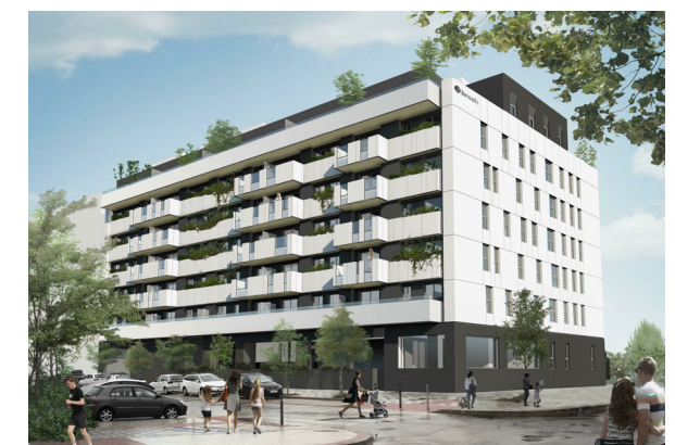
VISTA DESDE LA CALLE RAMÓN RUBIAL ESQUINA CALLE CIPRIANO DÍAZ EL HERRERO